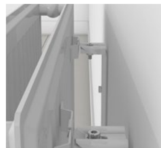
Finns för olika utföranden. För toppmontering på svets-söm eller för dold montering på bygel.