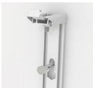
Enkel montering och justerbar i höjdlid för rätt placering.